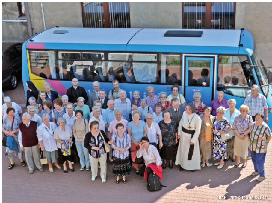
Katowice. Regionalny zjazd Przyjaciół Misji