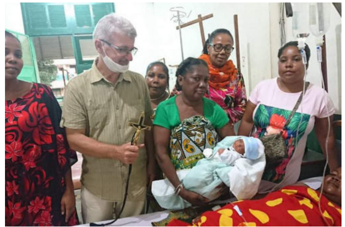
Jedno z uratowanych bliźniąt

Dwa miesiące temu napisałem cichą prośbę do przyjaciół i znajomych, z którymi znam się od wielu lat, aby pomogli