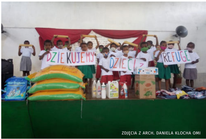
ZDJĘCIA Z ARCH. DANIELA KLOCHA OMI

Dzięki dobrym ludziom 25 dzieci z Refuge otrzymało konkretną pomoc