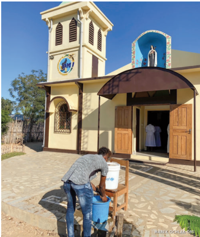
Befasy. Chrześcijanie chętnie dostosowują się do restrykcji sanitarnych

bankowych kontaktach. Chcąc jeść, trzeba się przemieszczać, trzeba pracować, muszą być otwarte drogi, żeby sprzedać plody ziemi.