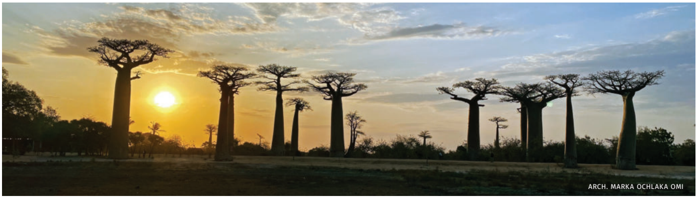
Morondava. Aleja baobabów w regionie Menabe