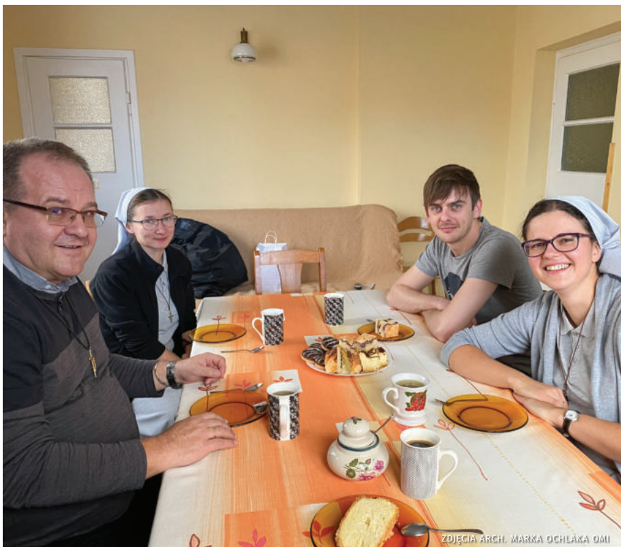
Wizyta u Sióstr Franciszkanek Misjonarek Maryi w Piastowie