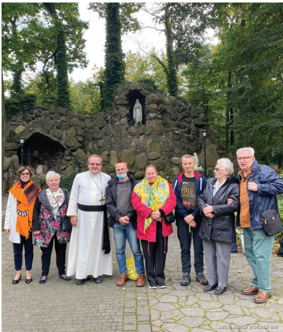
Katowice. Grupa Przyjaciół Misji

Pamiętajmy też o styczniowej intencji modlitewnej wyznaczonej przez papieża Franciszka: „za wszystkie osoby, które doświadczają dyskryminacji i prześladowań religijnych, aby społeczeństwo, w którym żyją, uznało ich prawa i godność, wynikające z tego, że jesteśmy braćmi i siostrami”.