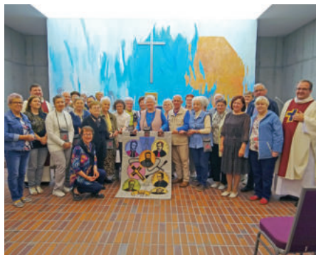
Zakończenie rekolekcji w kaplicy w Centrum Młodzieży NINIWA w Kokotku . Uczestnicy wraz z rekolekcjonistami