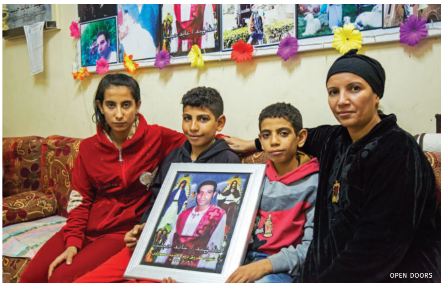
Rodzina Ayad z Egiptu. Tata zginął w ataku, nie wyparł się Jezusa

Pięćdziesiąt najbardziej opresyjnych państw aktualnie zamieszkuje prawie 4,8 miliardów ludzi. Warto zapoznać się z zamieszczoną w biuletynie mapą 50 krajów, w których dochodzi do największych prześladowań chrześcijan. Według oceny organizacji broniącej chrześcijan „Open Doors”, wysokiego poziomu prześladowań doświadcza 245 milionów osób. Dane na temat prześladowań chrześcijan znajdziemy w artykule Włodzimierza Tasaka pt. „Tragiczny los chrześcijan” zamieszczonym w numerze 2/2019 „Misyjnych Dróg”.